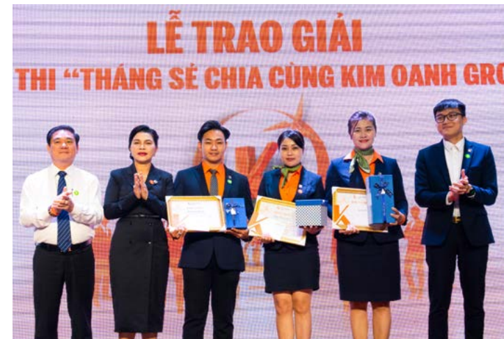
Trào giải cho các thành viên đạt kết quả cao nhất cuộc thi “Tháng Sẻ Chia cùng Kim Oanh Group”

Với những chia sẻ chân thành, cuốn hút từ diễn giả và Ban lãnh đạo, buổi hội thảo đã mang lại những thông tin bổ ích và nâng cao nhận thức cho toàn thể cán bộ, nhân viên về văn hóa. Đồng thời, đây cũng là bước tiến mới của Dự án tái tạo văn hóa, trong hành trình vun đắp, phát triển các giá trị văn hóa Kim Oanh Group.