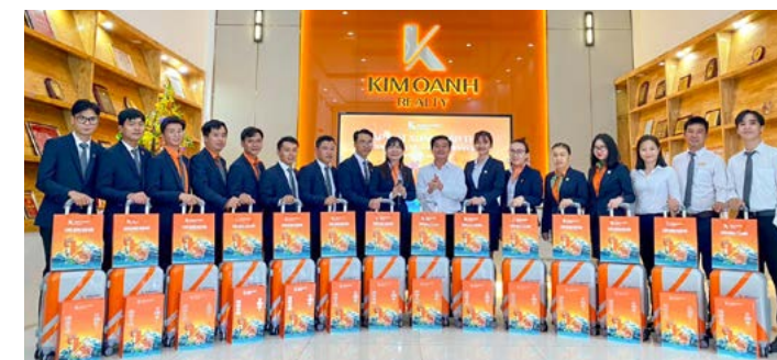
Chi nhánh Thành Phố Mới