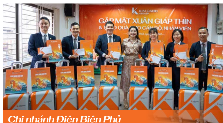
Chi nhánh Điện Biên Phủ