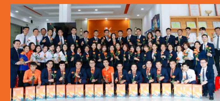
Chi nhánh Bến Cát