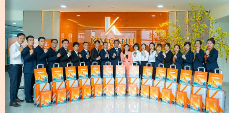
Chi nhánh Dĩ An