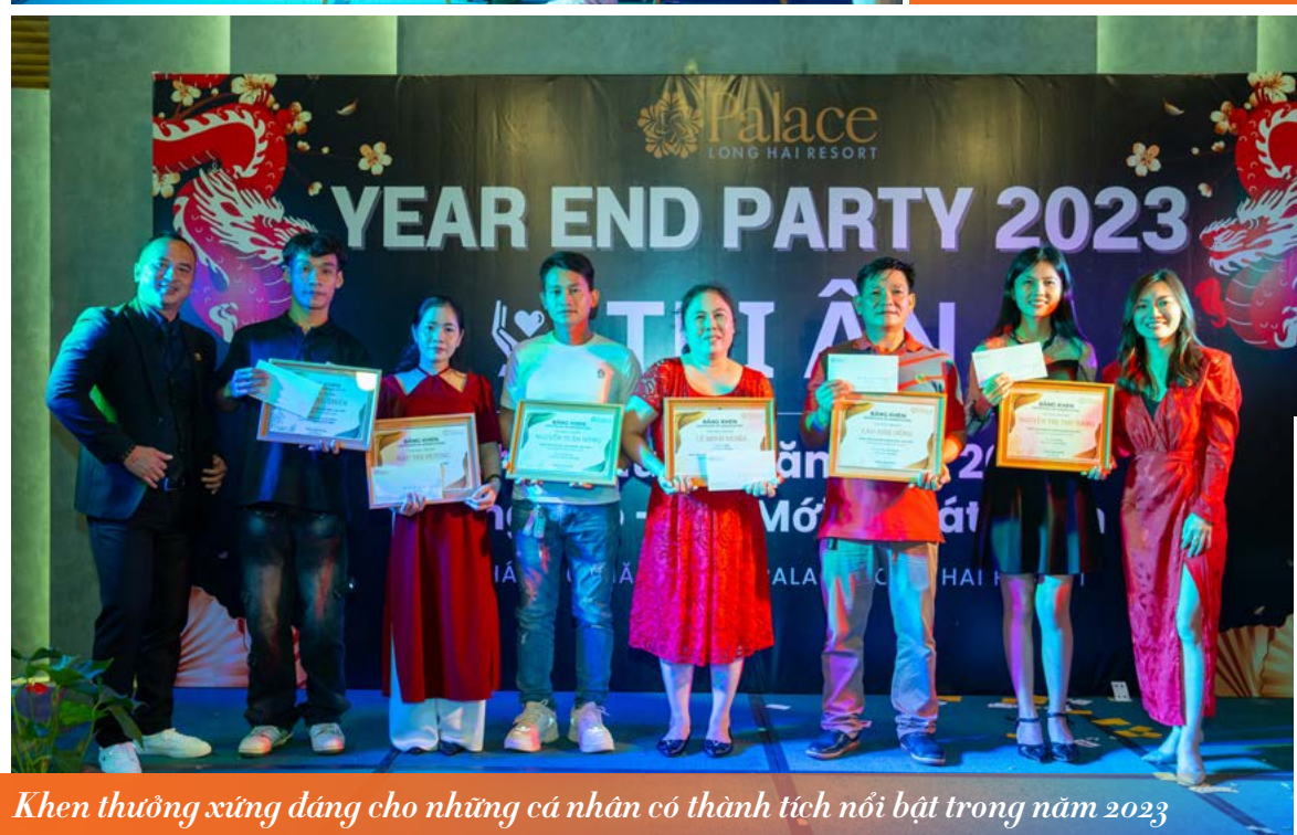
Khen thưởng xứng đáng cho những cá nhân có thành tích nổi bật trong năm 2023