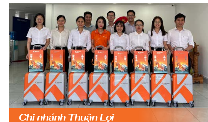
Chi nhánh Thuận Lợi