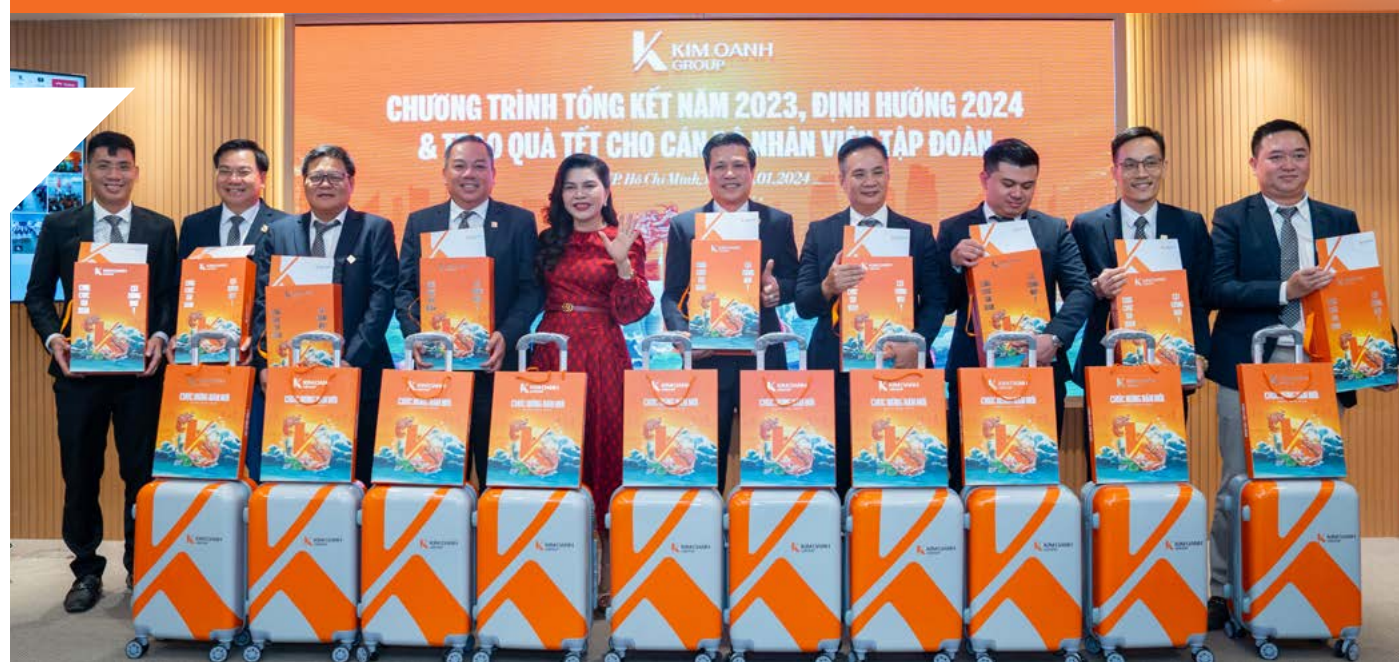
Chương trình gặp mặt và tặng quà cán bộ nhân viên tại Trụ sở Kim Oanh Group