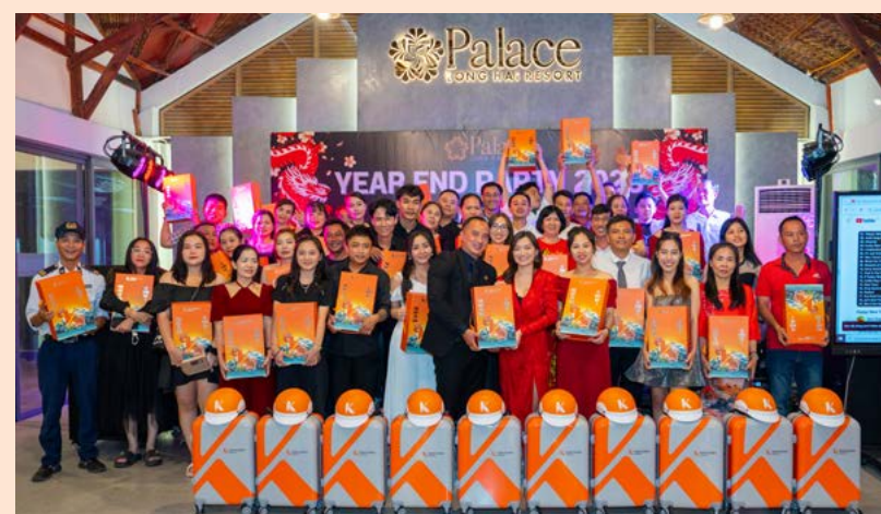
Palace Long Hai Resort