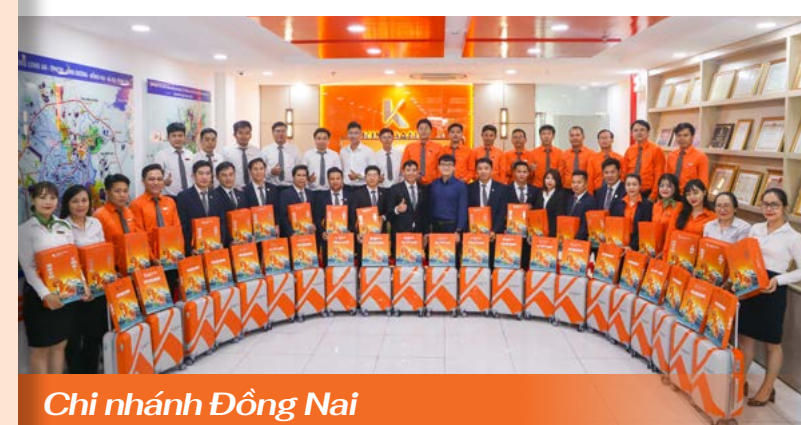
Chi nhánh Đồng Nai