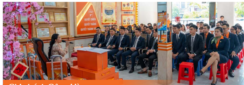
Chi nhánh Cộng Hòa