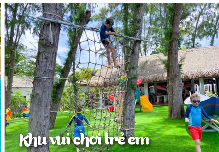
Khu vui chơi trẻ em