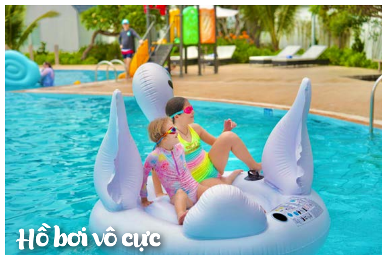
Hồ bơi vô cực