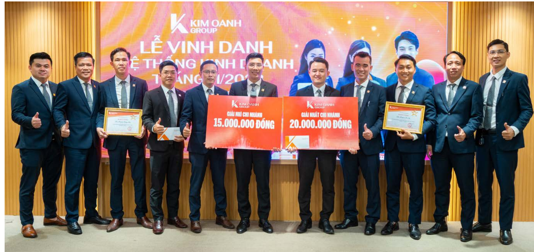
Các chi nhánh dẫn đầu về hiệu suất bán hàng tháng 11/2023

“Đây thực sự là món quà rất bất ngờ. Trong tháng 11, mặc dù Chi nhánh Dĩ An luôn ở top