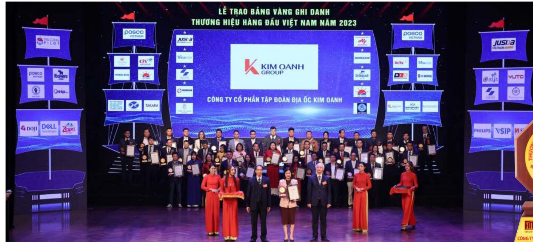
Đại diện Kim Oanh Group nhận kỷ niệm chương tại Lễ Vinh danh Top 10 Thương hiệu hàng đầu Việt Nam 2023.

Trải qua gần 16 năm phát triển, bằng nội lực mạnh mẽ cùng triết lý kinh doanh bền vững, Tập đoàn Kim Oanh đã vươn mình lớn mạnh, sở hữu một hệ sinh thái bất động sản khép kín được đông đảo khách hàng tin yêu lựa chọn. Hiện tại, Kim Oanh Group đã phát triển thành một thương hiệu bất động sản lớn và uy tín tại khu vực phía Nam. Hệ thống Kim Oanh Group hiện đang sở hữu 7 chi nhánh tại TPHCM, Bình