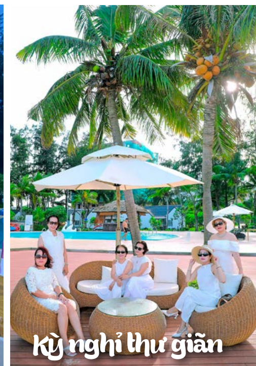
Kỳ nghỉ thư giãn