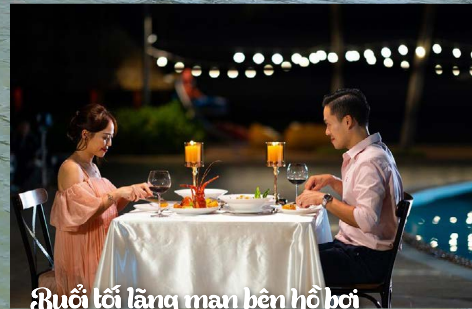
Buổi tối lãng mạn bên hồ bơi

Mời bạn đến Palace Long Hai Resort và tận hưởng cuộc sống êm đềm, đậm chất thơ mà vẫn nhộn nhịp, tươi vui trong những ngày đầu năm mới 2024. Palace Long Hai Resort còn là nơi du khách được tận mắt chiêm ngưỡng những khoảnh khắc đắt giá từ bình minh ửng hồng đến hoàng hôn tuyệt sắc giữa biển trời. Màn đêm buông xuống, một bữa tối lãng mạn trong không gian biển về đêm lung linh và yên tĩnh sẽ là món quà tinh tế dành tặng người thương.