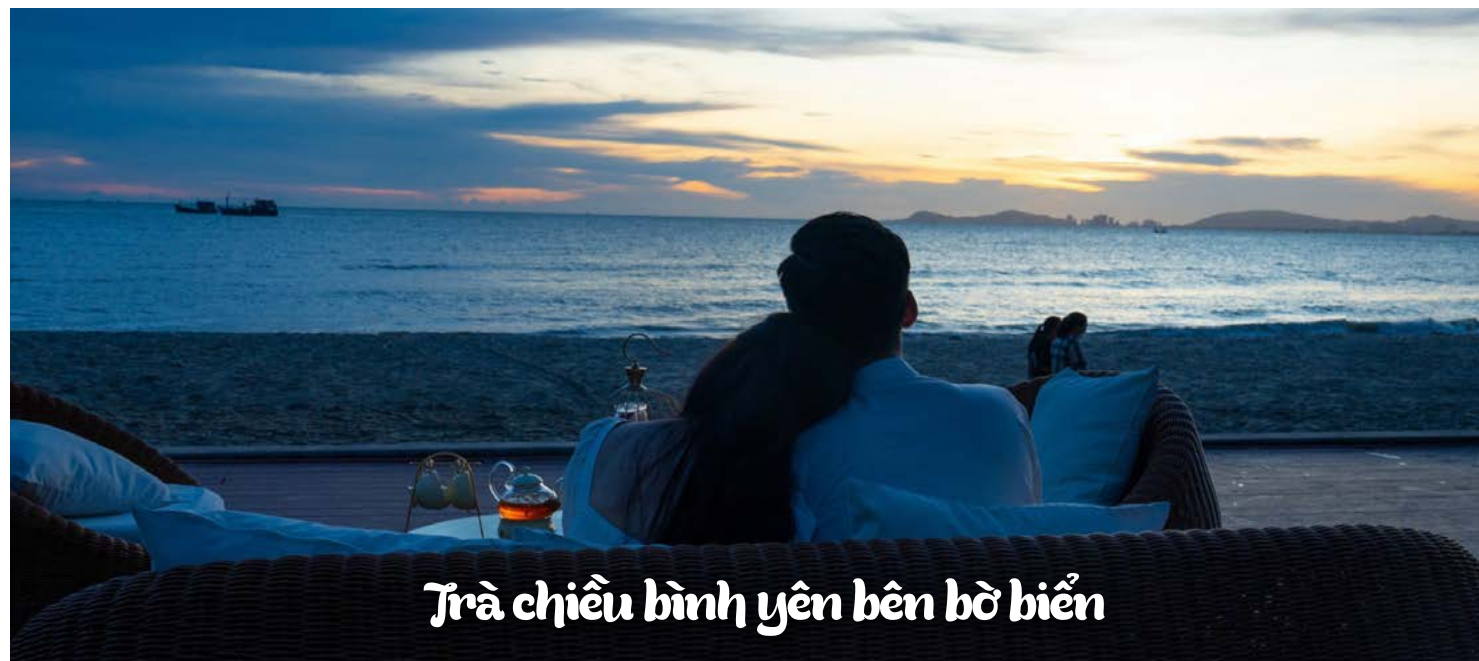
Trà chiều bình yên bên bờ biển