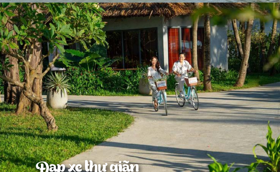
Đạp xe thư giãn

Mời bạn đến Palace Long Hai Resort và tận hưởng cuộc sống êm đềm, đậm chất thơ mà vẫn nhộn nhịp, tươi vui trong những ngày đầu năm mới 2024. Palace Long Hai Resort còn là nơi du khách được tận mắt chiêm ngưỡng những khoảnh khắc đắt giá từ bình minh ửng hồng đến hoàng hôn tuyệt sắc giữa biển trời. Màn đêm buông xuống, một bữa tối lãng mạn trong không gian biển về đêm lung linh và yên tĩnh sẽ là món quà tinh tế dành tặng người thương.