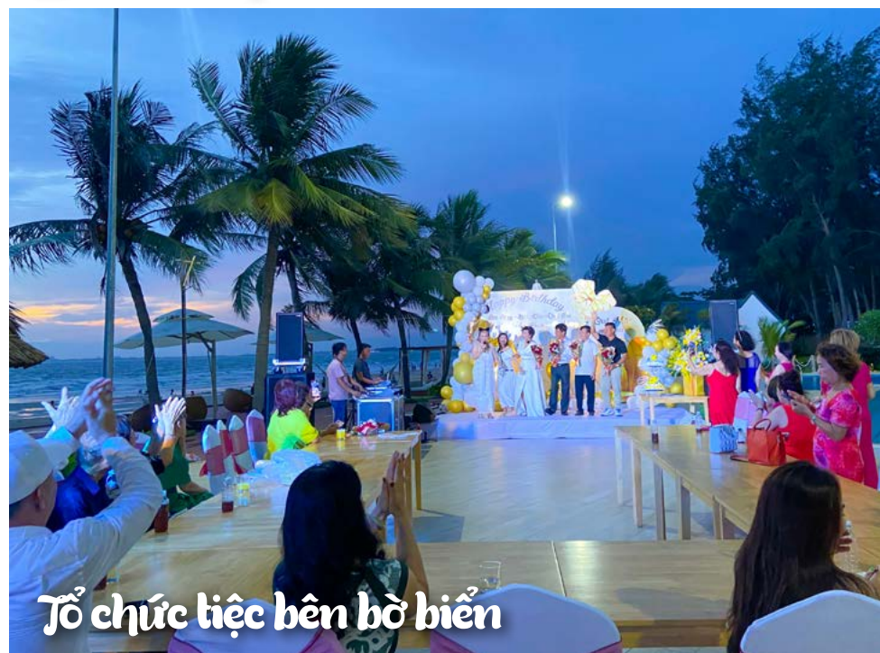
Tổ chức tiệc bên bờ biển