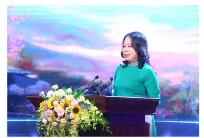
Phó Chủ tịch nước Võ Thị Ánh Xuân phát biểu tại chương trình

“Mong rằng, các nhà tài trợ, các tổ chức, cá nhân trong và ngoài nước tiếp tục dành thiện tâm, nguồn lực để chăm lo cho trẻ em nói chung và ủng hộ Quỹ Bảo trợ Trẻ em Việt Nam nói riêng, để trẻ em hôm nay luôn được sống trong tình yêu thương và trách nhiệm của chúng ta”, Phó Chủ tịch nước nói.