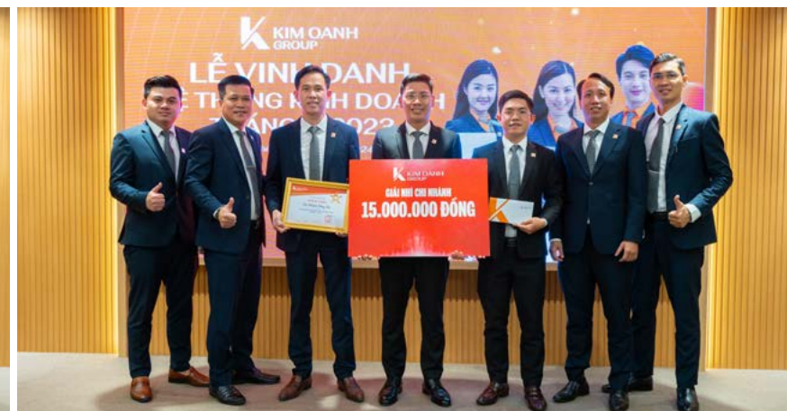
Chi nhánh Đồng Nai phấn khởi khi nhận giải NHÌ