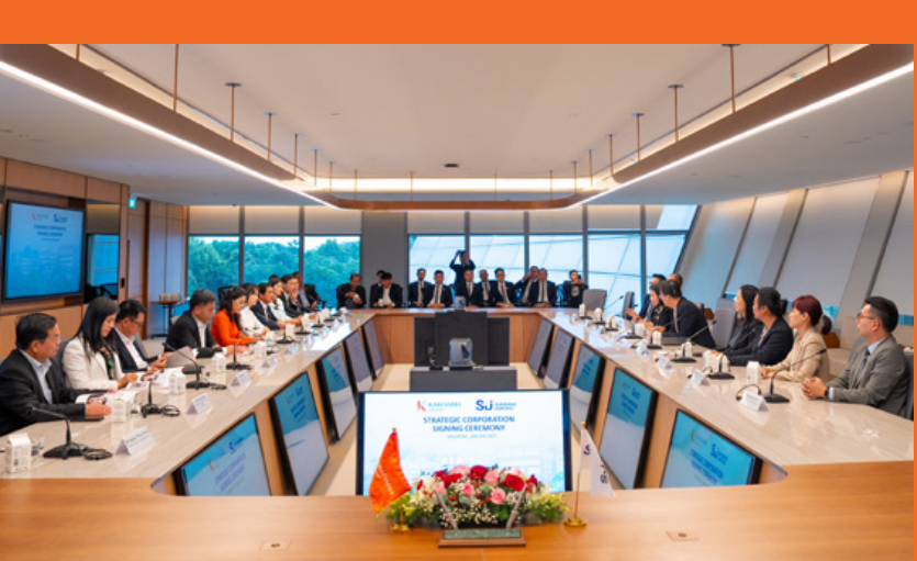
Sự ký kết hợp tác chiến lược với Surbana Jurong đã giúp Kim Oanh Group tiên phong phát triển mô hình nhà ở xã hội chuẩn Singapore tại Việt Nam