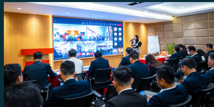
Chương trình đào tạo hệ thống kinh doanh dự án Legacy Prime được tổ chức tại trụ sở Tập đoàn và các sàn kinh doanh tham gia trực tuyến.

Sáng 18/7/2023, Kim Oanh Group tổ chức chương trình đào tạo hệ thống kinh doanh dự án Legacy Prime và khởi động “Chiến dịch 60 ngày đêm” với sự tham gia của đông đảo lãnh đạo và nhân viên Khối Kinh doanh Tập đoàn.