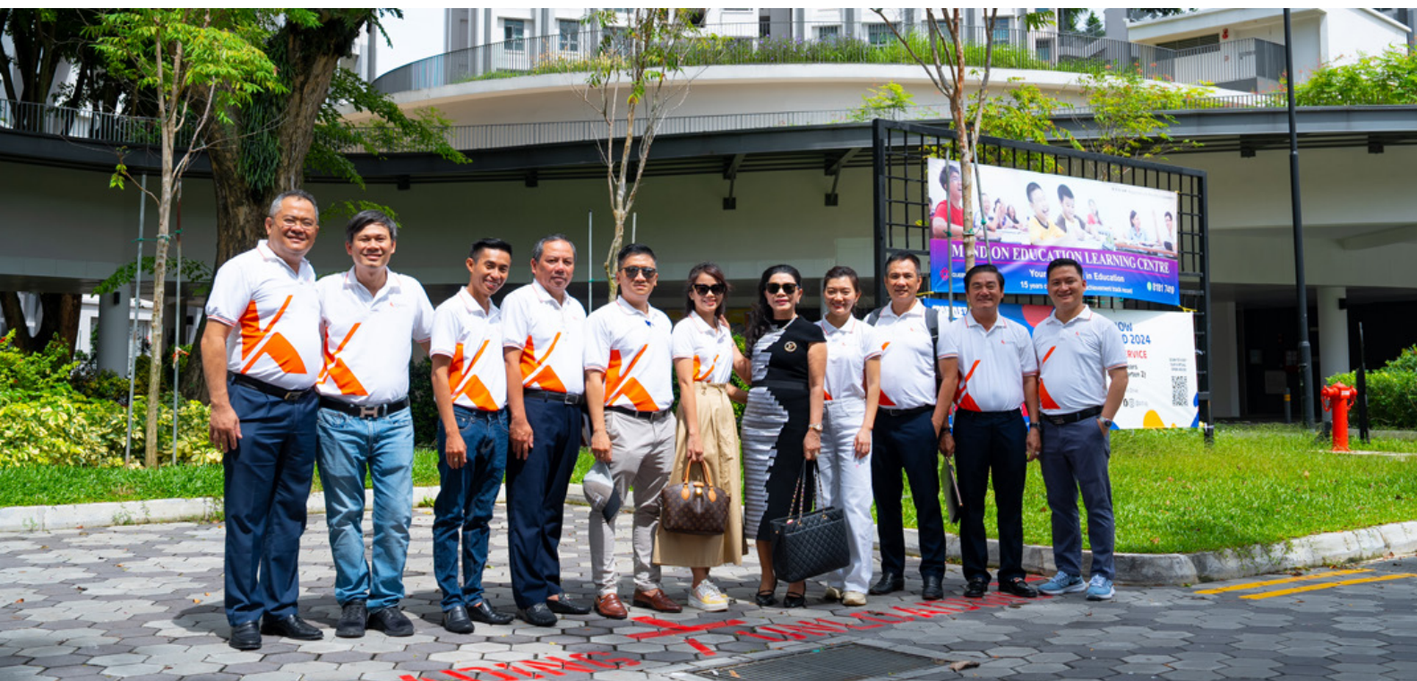
Đoàn công tác Kim Oanh Group chụp ảnh lưu niệm sau khi tham quan một dự án nhà ở xã hội của Surbana Jurong

T heo thỏa thuận ký kết, Kim Oanh Group và Surbana Jurong sẽ hợp tác phát triển một loạt dự án bất động sản nhà ở, bất động sản nghỉ dưỡng, tòa nhà văn phòng tại khu vực phía Nam. Đặc biệt, Surbana Jurong sẽ chịu trách nhiệm trong công tác tư vấn quy hoạch khu đô thị và tư vấn kiến trúc cho các dự án mà Kim Oanh Group chuẩn bị triển khai. Bên cạnh các dự án mang tính thương mại, việc hợp tác với Surbana Jurong còn giúp Kim Oanh Group tiếp cận các tiêu chuẩn phát triển nhà ở xã hội của Singapore để áp dụng tại Việt Nam. Bởi Surbana Jurong là tập đoàn có nhiều đóng góp cho công cuộc phát triển của Singapore khi xây dựng hơn 80% số lượng nhà ở xã hội tại đất nước này.