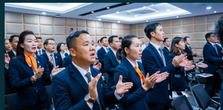
Hệ thống bán hàng Kim Oanh Group hát vang bài ca truyền thống “Tự hào Địa ốc Kim Oanh” đốt nóng tinh thần chiến binh để khởi động “Chiến dịch 60 ngày đêm” bút tốc giao dịch cùng dự án căn hộ Legacy Prime.