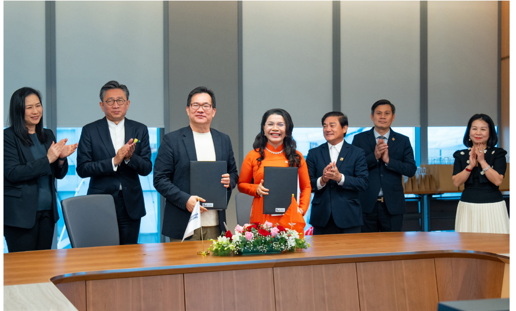
Cú bắt tay chiến lược giữa Kim Oanh Group và Surbana Jurong hứa hẹn nhiều triển vọng

Ngày 14/7/2023, tại Singapore, Tập đoàn Surbana Jurong và Kim Oanh Group đã long trọng tổ chức lễ ký kết hợp tác chiến lược nhằm phát triển các dự án bất động sản do Kim Oanh Group làm chủ đầu tư. Đây là một cột mốc mới trong hơn 15 năm hình thành và phát triển của Kim Oanh Group.