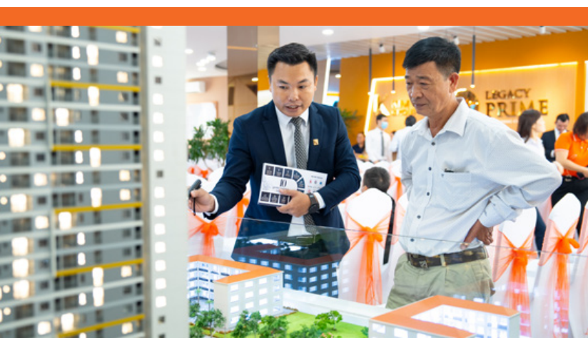
Các chủ đầu tư phía Nam mạnh tay bung hàng kèm theo nhiều chính sách hấp dẫn