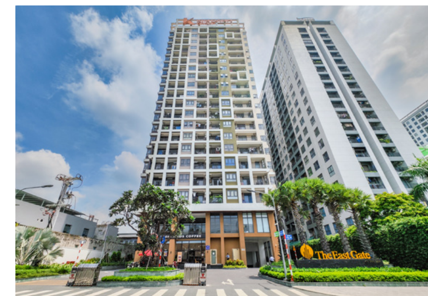
Căn hộ The EastGate hiện đang là tổ ấm an cư bền vững của đông đảo cư dân khu Đông

Bên cạnh căn hộ The EastGate, Kim Oanh Group cũng đang đẩy nhanh tiến độ tại nhiều dự án như: Khu căn hộ Legacy Prime, Khu đô thị Richland Residence, Khu đô thị Century City, Khu đô thị Mega City... Được biết, tất cả các dự án này về cơ bản đều đã hoàn thiện hạ tầng, Kim Oanh Group đang tiếp tục phát triển các tiện ích và hoàn tất các thủ tục ra sổ. Dự kiến, từ nay đến hết 2023, Kim Oanh Group sẽ bàn giao sổ thêm 2 dự án khác cho khách hàng.