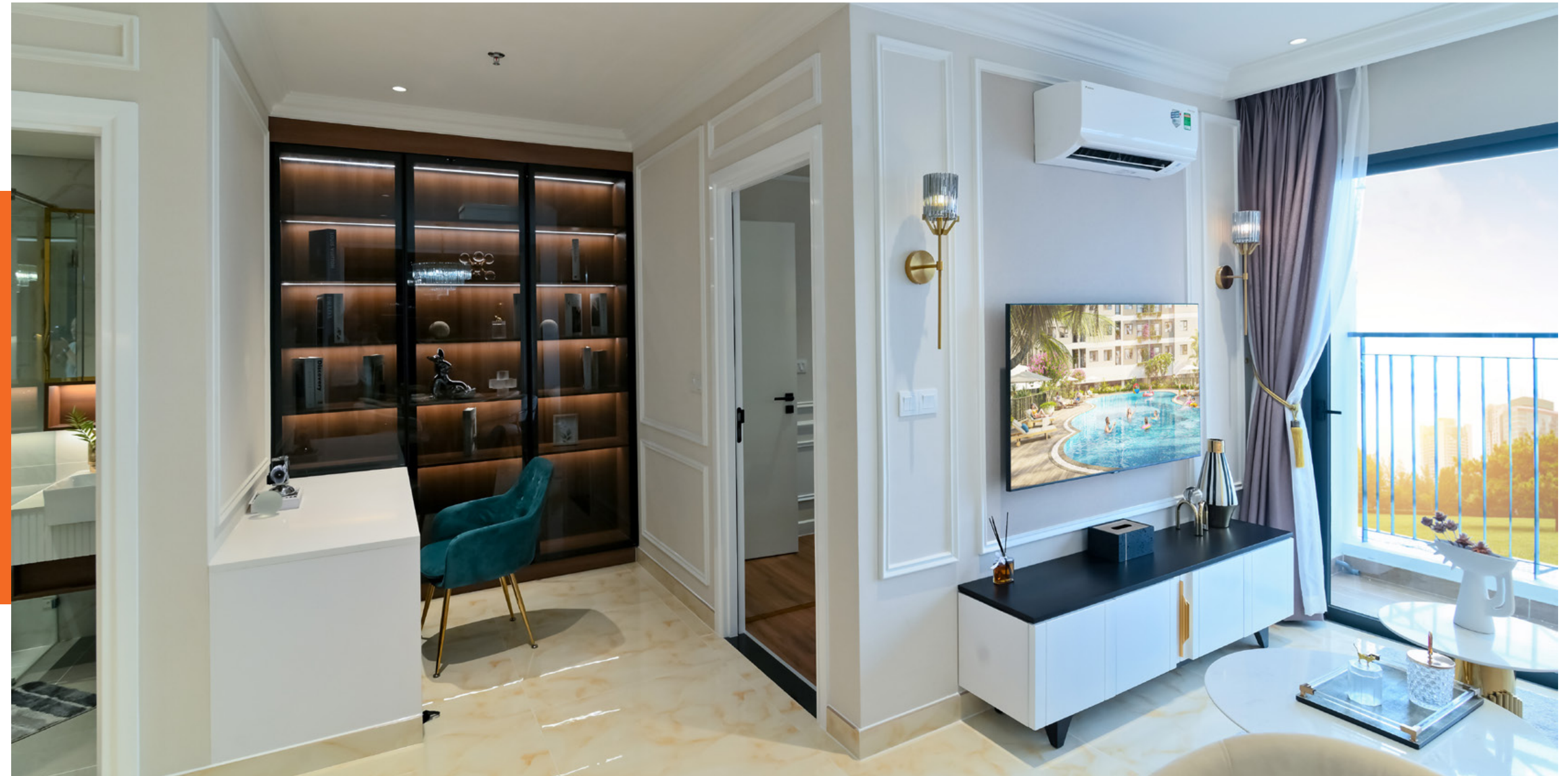
Căn hộ Studio tại Legacy Prime được thiết kế thông minh, bố trí nội thất tinh tế và tiện nghi giúp tối ưu không gian sống

Bên cạnh mức giá hấp dẫn nhất thị trường, dịp này Kim Oanh Group còn công bố chính sách ưu đãi hấp dẫn dành cho khách hàng mua giỏ