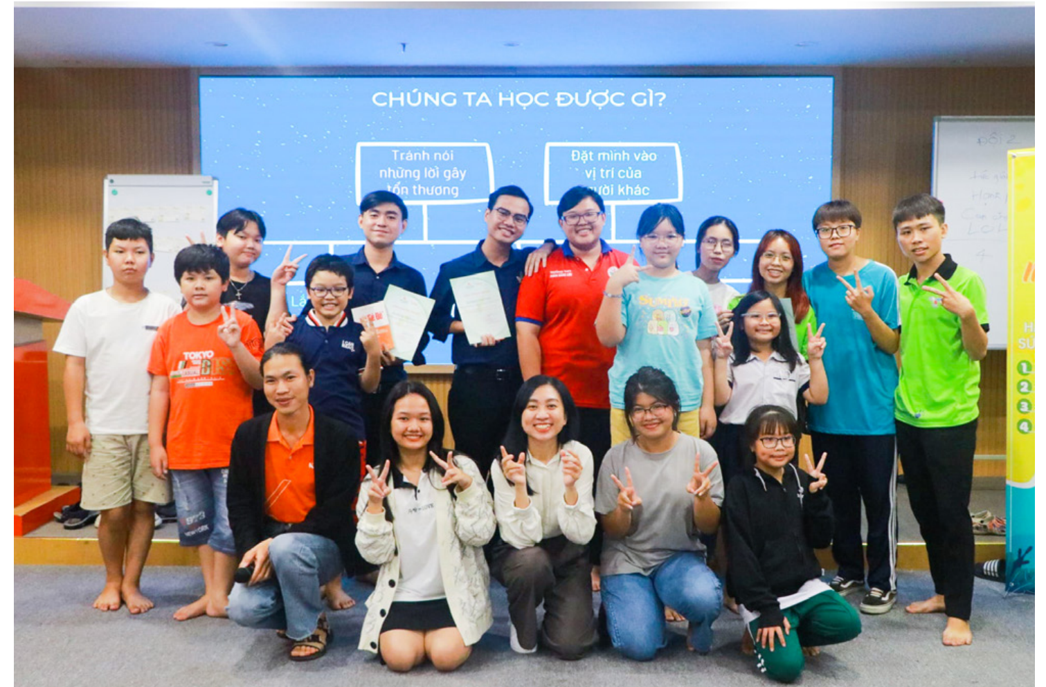
Lớp học hè 2023 mang đến những trải nghiệm thú vị cho trẻ thuộc dự án Cùng làm cha mẹ

Theo đó, tại chương trình, Quỹ từ thiện Kim Oanh tiến hành trao tặng 500 phần quà (mỗi phần quà trị giá 1 triệu đồng). Trong đó, 200 phần quà trao tặng cho người có công, nạn nhân chất độc màu da cam; 300 phần quà trao tặng cho học sinh là con em gia đình chính sách, có công với cách mạng, gia đình dân tộc thiểu số. Ngoài ra, Quỹ từ thiện Kim Oanh cũng trao tặng 5 nhà Đại đoàn kết cho gia đình chính sách, người có công với cách mạng tại tỉnh Quảng Trị (mỗi căn trị giá 80 triệu đồng); tổ chức Đại lễ cầu siêu cho các anh hùng liệt sĩ tại Nghĩa trang Liệt sĩ Quốc gia Trường Sơn; đi thăm hỏi, động viên một số gia đình chính sách, nạn nhân nhiễm chất độc màu da cam tại tỉnh Quảng Trị.