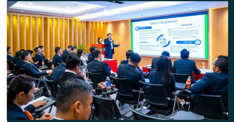
Đại diện Khối Truyền thông và Tiếp thị Tập đoàn chia sẻ kế hoạch marketing dự án Legacy Prime.