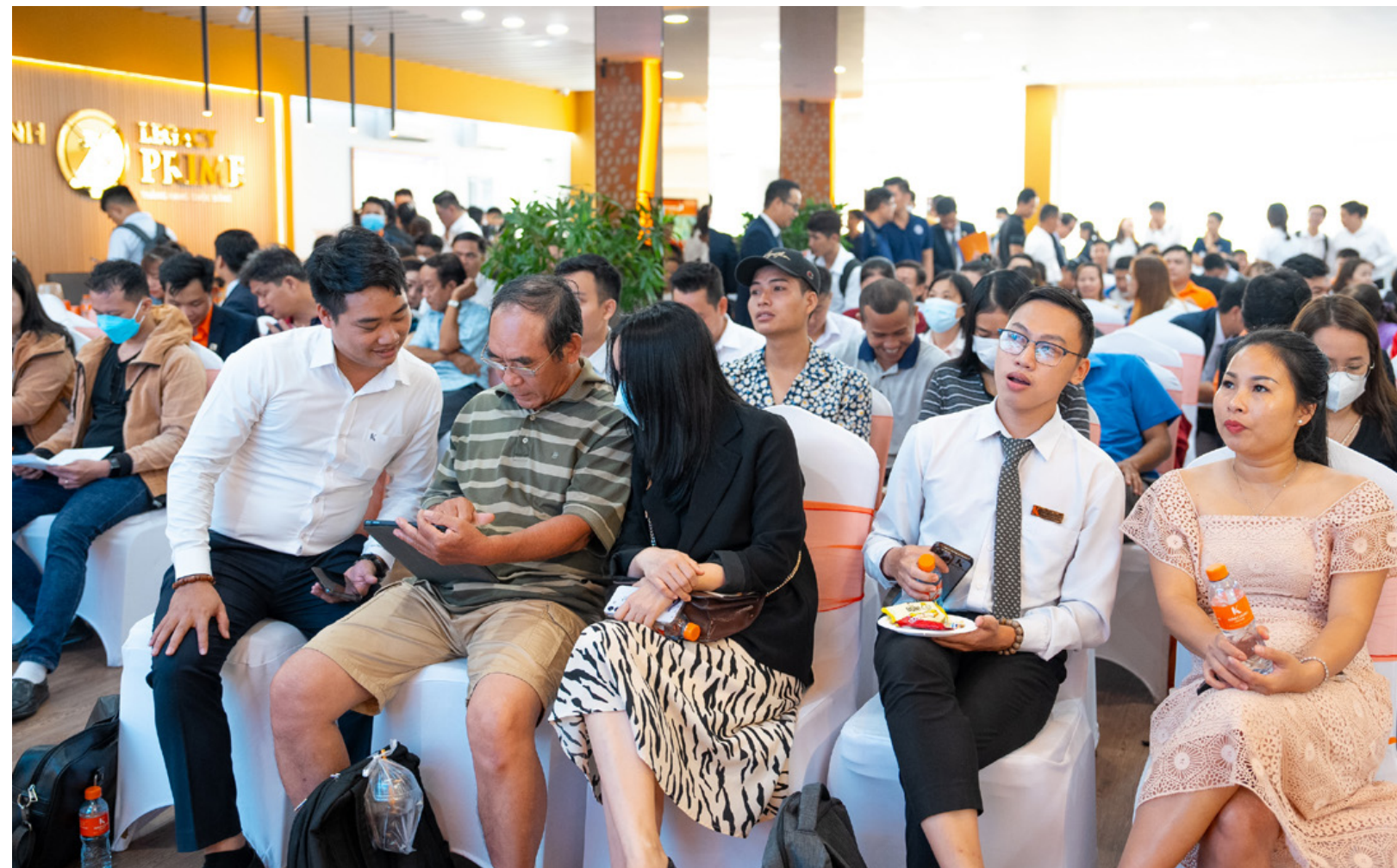
Legacy Prime ghi nhận lượng khách tham quan ấn tượng vào mỗi cuối tuần