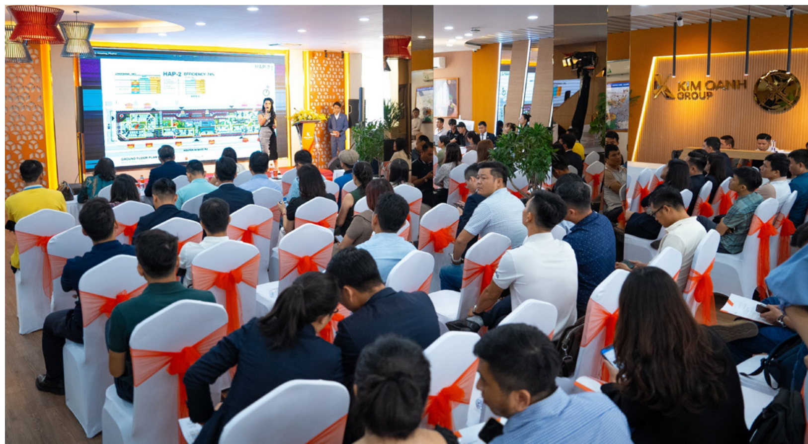
Sự kiện thu hút đông đảo phóng viên báo chí và đài truyền hình đến tham dự, đưa tin

Ngày 22/7/2023, tại Nhà bán hàng dự án Legacy Prime (TP. Thuận An, tỉnh Bình Dương), Ban lãnh đạo Kim Oanh Group đã công bố kế hoạch xây dựng nhà ở xã hội trong giai đoạn sắp tới. Đây là chiến lược mới của Kim Oanh Group với mong muốn góp phần cùng chính quyền các địa phương tạo thêm điều kiện thuận lợi để sở hữu nhà ở cho đông đảo người lao động. Sự kiện đã thu hút sự quan tâm tham dự của đông đảo anh chị phóng viên báo chí và đài truyền hình.